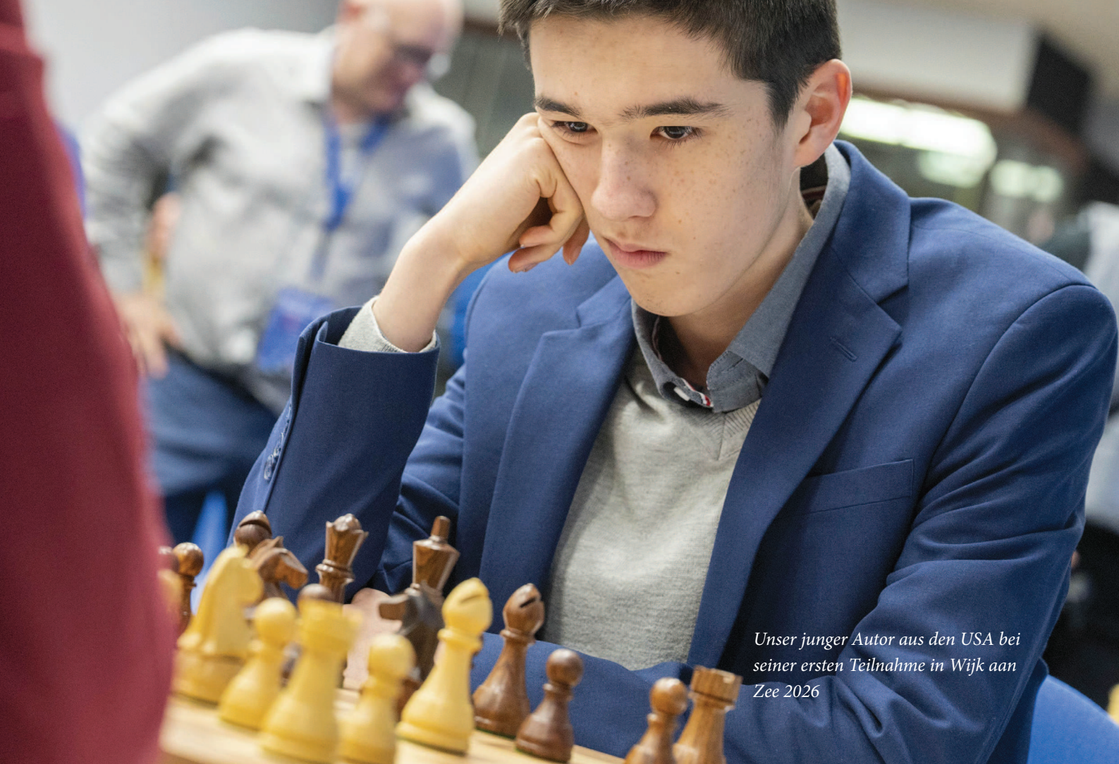
Unser junger Autor aus den USA bei seiner ersten Teilnahme in Wijk aan Zee 2026

32...Ta1+ 33.Kf2 Sf6! Sg4+ ist eine Drohung, und sie ist schwer zu stoppen.